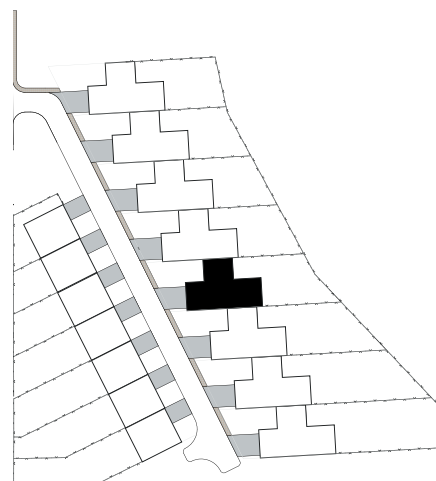
poloha domu v zástavbě

K možným nadstandardům, za které si však budoucí majitelé připlatí, pak lze jmenovat např. zbudování krbu, připojení jednotek klimatizace nebo centrálního vysavače (rozvody již jsou vybudovány v ceně standardů).